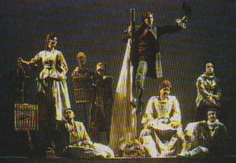
Una scena da "Memories"